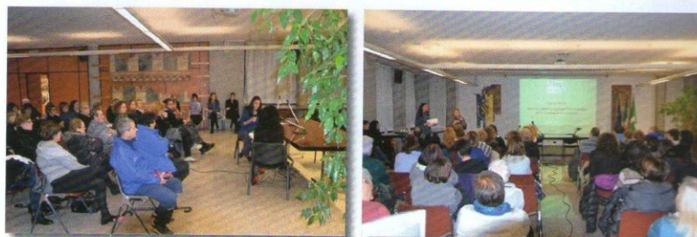
Alcuni momenti della serata del 25 novembre in Sala Consiliare